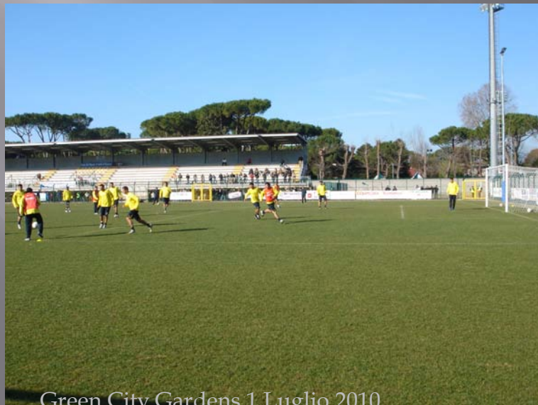
Green City Gardens 1 Luglio 2010