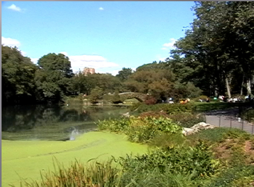
Green City Gardens 1 Luglio 2010

Valenza estetica: rendere le nostre città più accoglienti