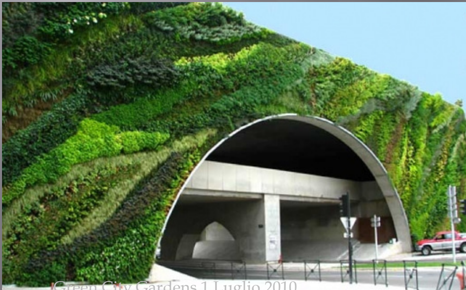
Green City Gardens 1 Luglio 2010