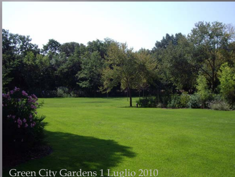
Green City Gardens 1 Luglio 2010