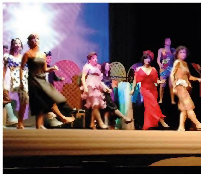
Un momento dello spettacolo

"Pane, amore e... musica" descrive proprio questo: «Il nostro amore per il teatro popolare e la commedia musicale, il nostro radicamento nella comunità in cui siamo nati e a cui apparteniamo, la nostra gratitudine per aver trovato/ritrovato la possibilità di far vivere, per una sera, le nostre passioni all'interno della nostra "casa" più naturale: il teatro Verdi, donato un secolo fa a Casciana